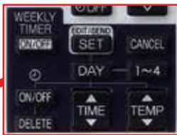
Пример использования таймера: зима/режим нагрева

1 Режим работы не может быть изменен по таймеру.